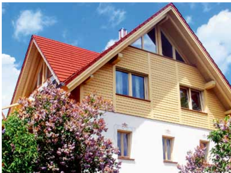
woonhuis na 6 jaar