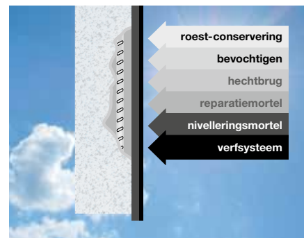
Zonder RELIUS Concrete Uni-M.